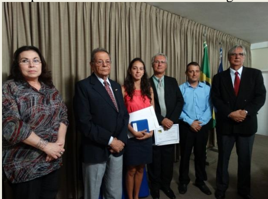
Acima: os agraciados com a comenda