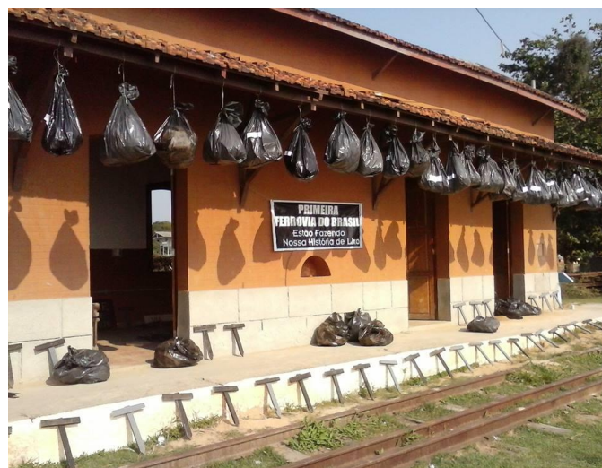
Estação Guia de Pacobaíba/Magé

Enquanto isso, a E. F. Mauá , tombada pelo Patrimônio Histórico em 1954 – ano do seu centenário - continua um tanto “abandonada” (para ser gentil), o que tem levado a população de Guia de Pacobaíba a promover inúmeros protestos. A foto abaixo é do protesto mais recente. Além das 161 Cruzes, penduraram sacos de lixo e o seguinte cartaz: “ Primeira Ferrovia do Brasil - estão fazendo nossa história de lixo ”.