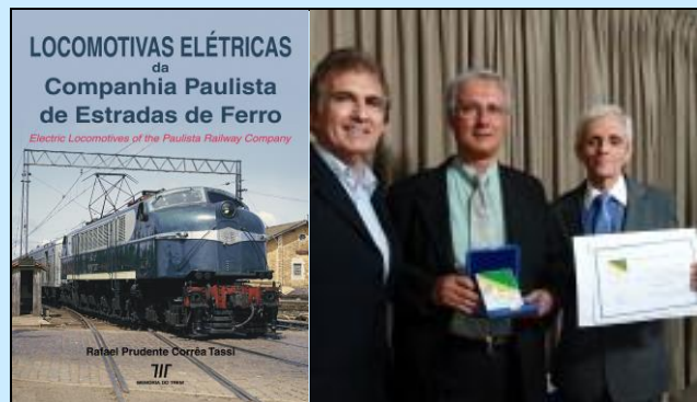
Capa do Livro